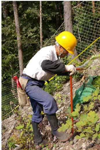
1.案内棒で植栽穴をあける