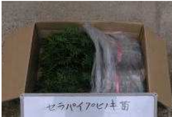
ダンボール箱に400本(50×8束)入れ可能