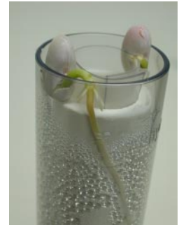
発芽直後のインゲン

机の上など目に付くところにけるので、日々の変化に気付けます 様々な実験設定を行うことができます