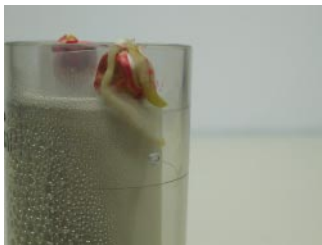
発芽直後のトウモロコシ

根がみえる状態で成長するので、根の観察も簡単で、 日々の変化を目にすることができます