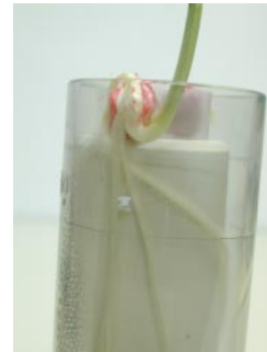
どんどん根が伸びていく